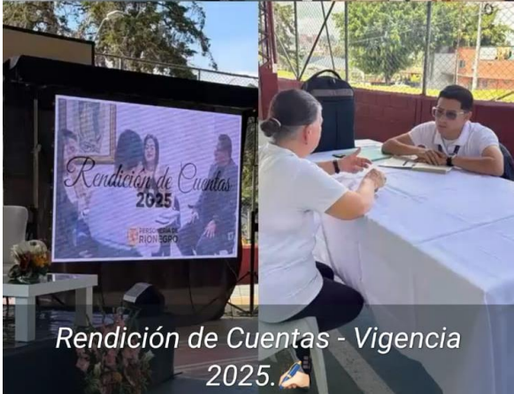
Rendición de Cuentas - Vigencia 2025.