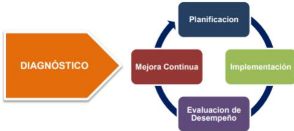
Figura 1: (MSTI, 2020 Ciclo de operación del Modelo de Seguridad y Privacidad de la Información)

El ciclo de operación tiene 5 componentes que se armonizan para dar el cumplimiento necesario al Plan de Seguridad y Privacidad de la Información, basado en la confidencialidad, integridad y disponibilidad; lo que permite brindar el uso idóneo a la información y mantener un desarrollo sostenible dentro de la entidad.